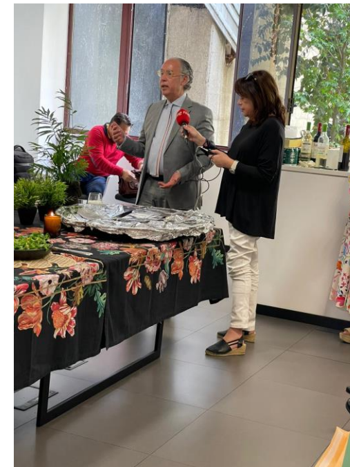
Rueda de prensa: VI Feria de Servicios.

Reunión sostenida con el Director para América Latina de la Fundación Jose Ortega y Gasset – Gregorio Marañón para integrar a la fundación en la organización de la VI Feria de Servicios.