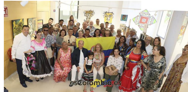
Arte América 2023 COLOMBIA, Anfitrión de Iberoamérica en Madrid