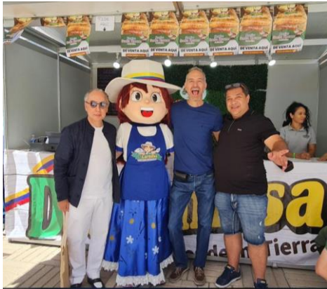
Fiesta del 20 de julio en la terraza de la Estación de Chamartín, organizada por Tienda Colombia

El Cónsul General acompañó a la comunidad colombiana en las diferentes celebraciones que realizaron las asociaciones en el marco de la celebración del 20 de julio