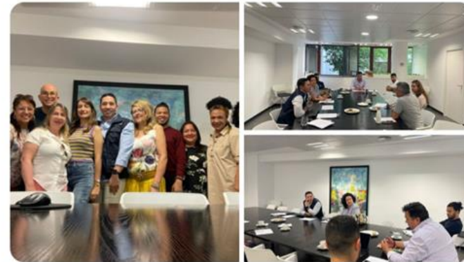
👤 Gustavo Petro y Doris Salcedo

Liderazgos, Asociaciones, y emprendimientos de los colombianos residentes en la comunidad de Madrid - España se ha desarrollado una amplia mesa de trabajo donde se han escuchado las propuestas para la formulación de proyectos que serán entregados a Colombia Nos Une.